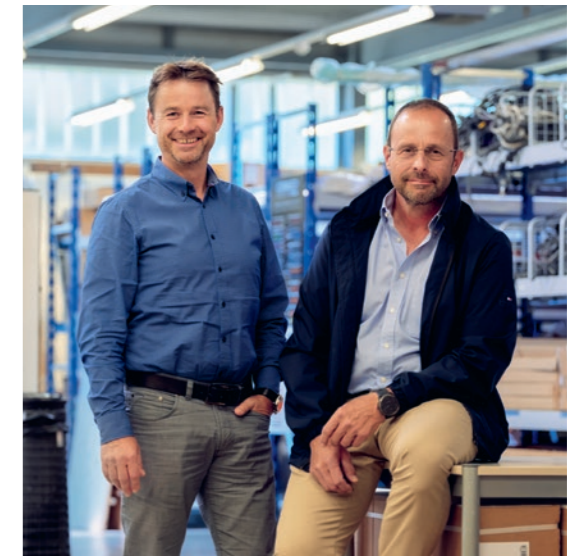
12 | Ils ont ouvert la voie et s'en portent bien Diversification vers la technique du bâtiment