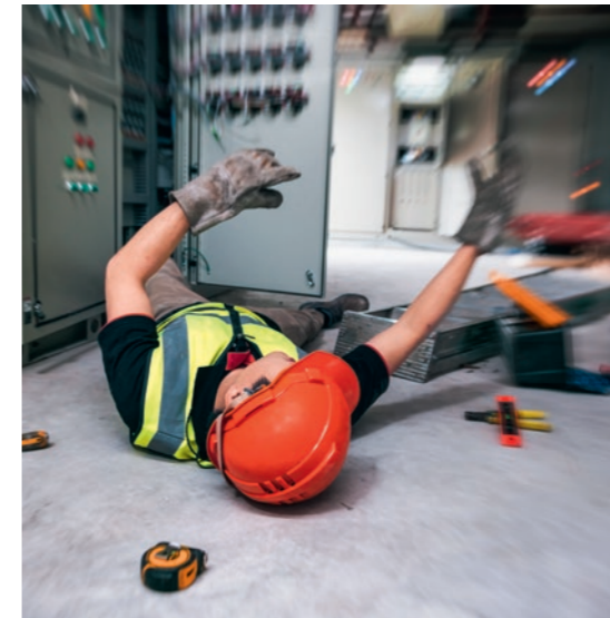
22 | Sécurité des travailleurs isolés Ce qui est autorisé, interdit, et à quoi il faut faire attention.