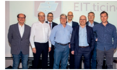
Le Comité cantonal d'EIT.ticino