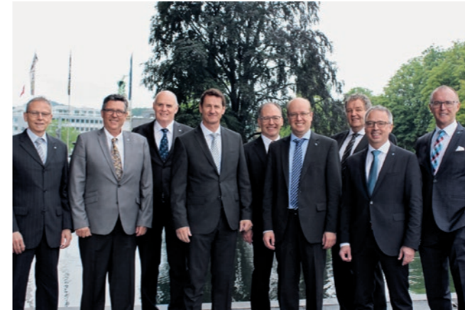
06 | Comité d'EIT.swiss Présentation des trois nouveaux membres