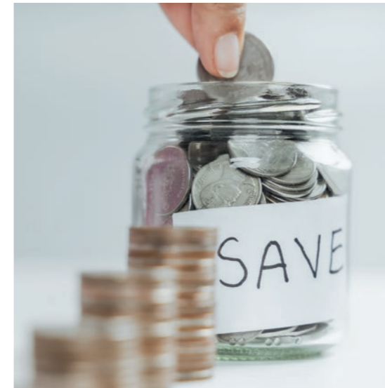
22 | Suva-Prämien 2024 sinken weiter Prämienreduktion sowohl in der Berufs- als auch der Nichtberufsunfallversicherung.