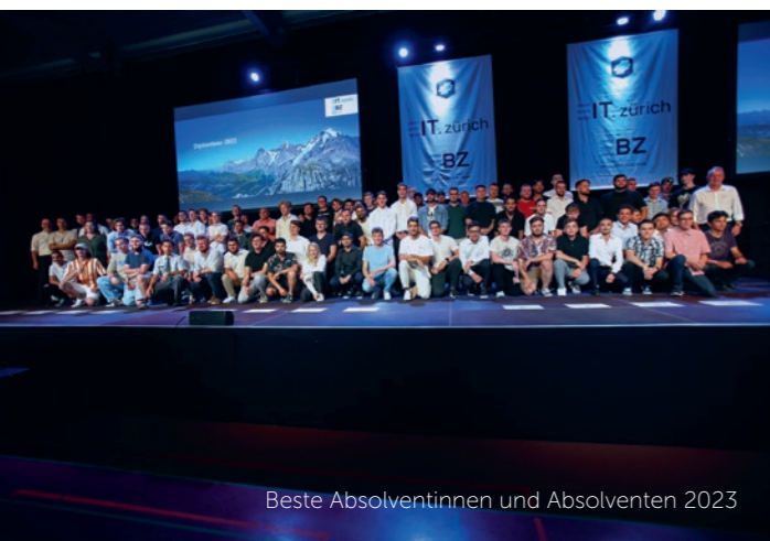
Beste Absolventinnen und Absolventen 2023