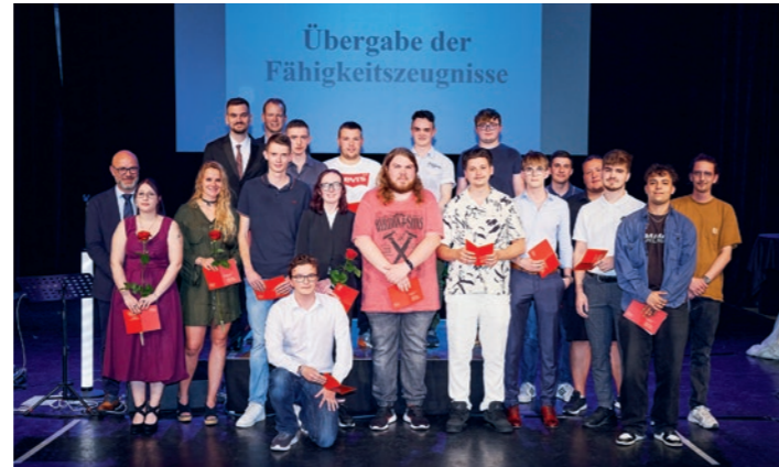
Einige der erfolgreichen Absolventinnen und Absolventen.