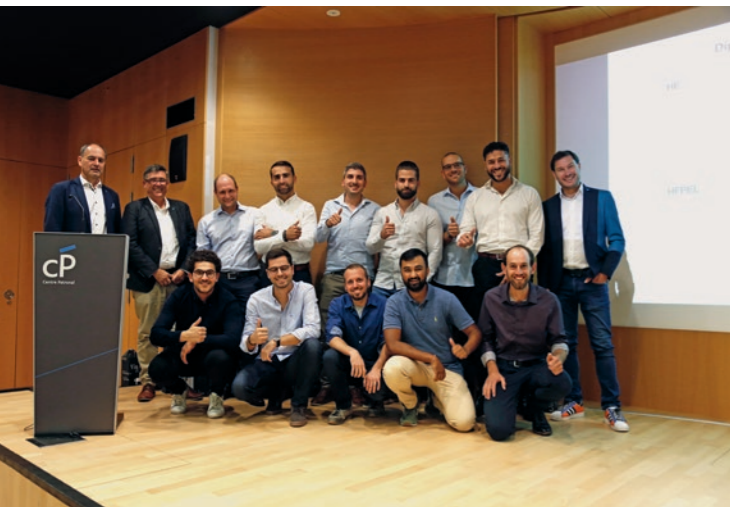
In einer Welt, die zunehmend von Elektrizität abhängig ist, ist ihre Rolle von entscheidender Bedeutung.