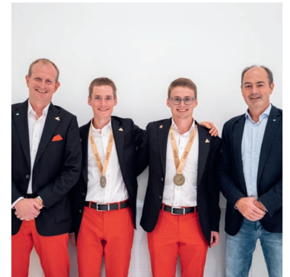
06 | Doppelgold für die Schweiz Sensationelle Leistung der Schweizer Delegation an den EuroSkills in Prag.